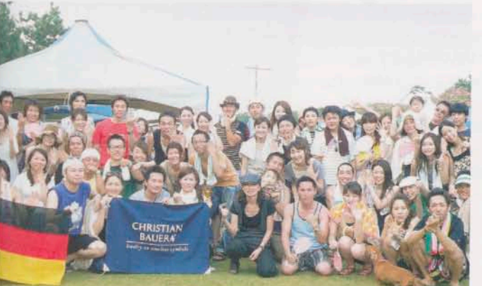
Ein Land, in dem Gruppendynamik groß geschrieben wird: Allen Brautpaaren ist eines gemeinsam: Sie haben sich für Eheringe von Christian Bauer entschieden.

man dann auch, mit welchem Edelmetall man es zu tun hat und welcher Diamant gefasst wurde, der auf dem Trauring sitzt. Markenprodukte geben Ihnen Qualitätssicherheit, das ist beim Schmuck nicht anders als bei einer hochwertigen Uhr oder einem tollen Auto. Versuchen Sie, sich bei Ihren Trauringen nicht in erster Linie von Ihrem Budget leiten zu lassen. Trauringe sind eine hochemotionale Angelegenheit und die Ausgabe dafür macht sich bezahlt. Schließlich wollen Sie ja nicht, dass die weißgoldene Rhodinierung abblättert oder der Edelstein schlecht gefasst ist und herausfällt. So hätte sich die beste Sparmaßnahme nicht gelohnt. Und Sie wollen ja an Ihren Trauringen ein Leben lang Freude haben.