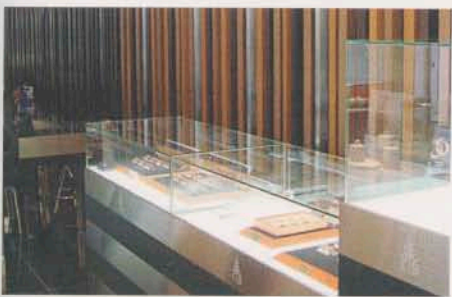
Große Vitrinen und edle Hölzer findet man in den eigenen Flagship-Stores, von denen es inzwischen fünf Geschäfte in Japan gibt.

ihr eigenes Gesicht zu geben. Solch ausgereifte Optiken werden auch von Bösewichten schnell erkannt und gerne rücksichtslos kopiert. Wenn es professionell gemacht ist, sieht man